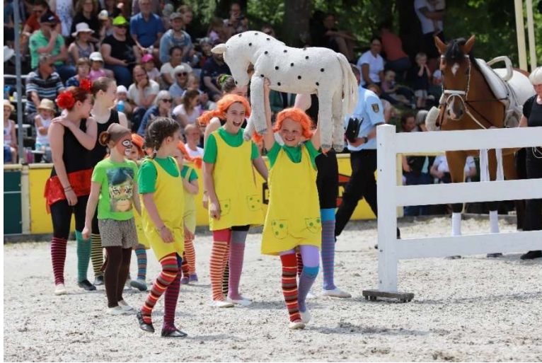
Ein Publikumsmagnet: die Voltigiergruppe Marbach